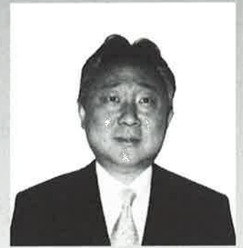
재일본조선문학예술가동맹 중앙상임위원회 위원장

저는 문예동무용부맹원들이 이 경연대회를 계기로 앞으로 기량제고를 위해 꾸준히 노력함으로써 재일동포사회에서 민족성을 지키기 위한 전군중적인 운동에 적극 기여해주기를 바랍니다.